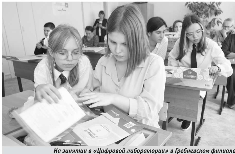
На занятии в «Цифровой лаборатории» в Гребневском филиале