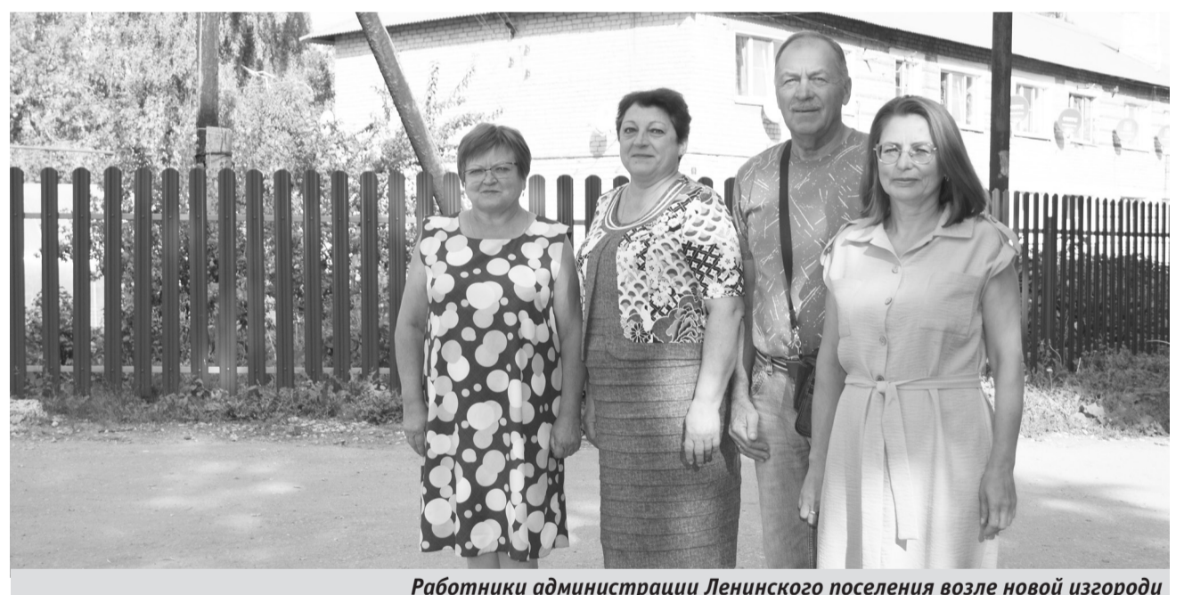
Работники администрации Ленинского поселения возле новой изгороди