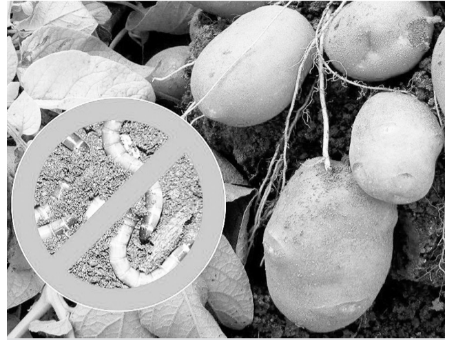
Так выглядит проволочник в картофеле

Если после уборки урожая картофеля некоторые клубни оказались с прогрызенными лабиринтами ходов, а на картофельном участке попадались небольшие оранжевые или желтые червячки, жесткие, как проволока, – на участке поселился проволочник.