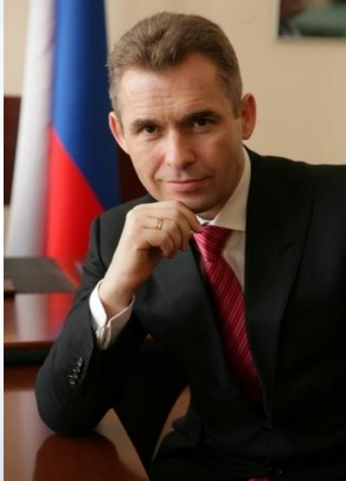
в Российской Федерации Павел Астахов